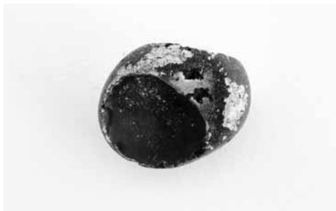
Orla Barry, Outer Galaxy Stone

da série / from the series / de la série: Collection 1996-2011