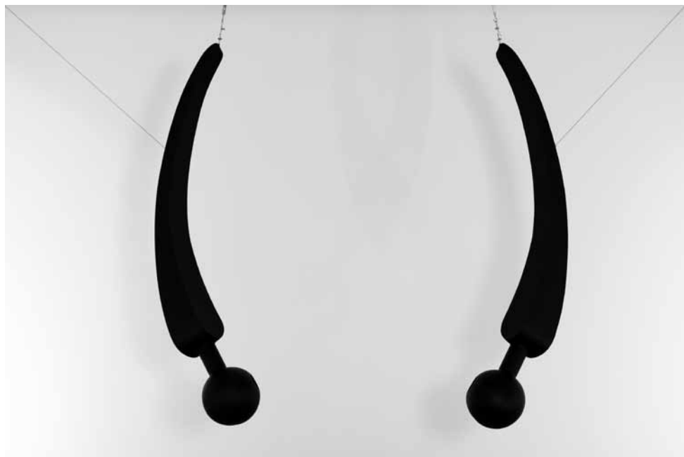
Rui Chafes, Your Voice in the Air Swirls Around Me , 2011