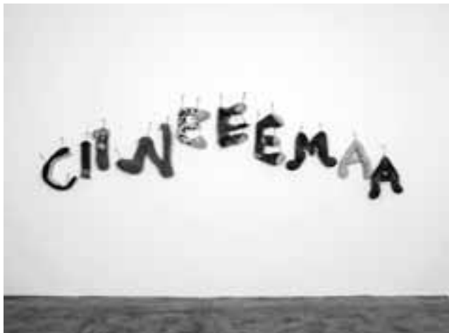
Annette Messager [1943] Ciineema , 2001

essencialmente, no período seguinte à Segunda Guerra Mundial e no contexto das sublevações que ocorreram nas décadas de 1960 e 1970 em diferentes pontos do mundo. Estas obras possuem em comum o facto de questionarem o lugar do homem na história contemporânea, introduzindo, em particular, nos seus dispositivos, a presença da palavra, quer se trate da palavra escrita ou do som. Desta forma, os artistas reunidos em torno deste projecto partilham uma vontade de «sair do silêncio da pintura» para desenvolverem propostas de um género novo, sendo que algumas agitaram de forma duradoura a história da arte. Silêncios é um labirinto, tanto no sentido próprio como simbólico do termo. O visitante poderá sempre perder-se, mas terá também a possibilidade de experimentar o encontro privilegiado com obras cujo contributo é universal, através desse «museu imaginário» muito pessoal.